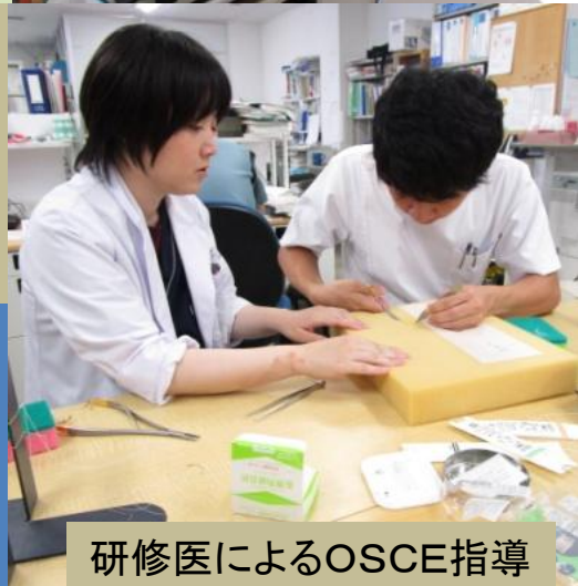
研修医によるOSCE指導

医療面接や、外科手技等のOSCE対策をしてもらいました大変充実した二日間でした(4年G.T)