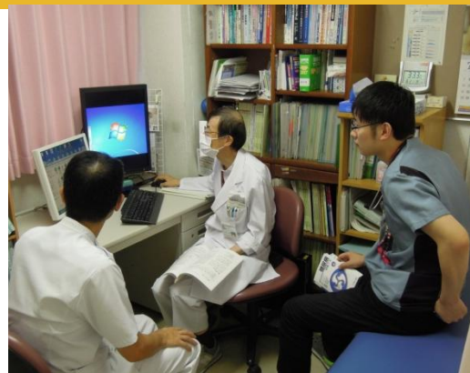
実習振り返りまとめ発表

医療生協わたり病院の医学生通信です☆ 今回は1年間の実習の感想の総まとめを送ります。次号からは研修医→の様子もお伝えしていきます!(気になりますよね?)今後も医学生通信PEACEをどうぞよろしく(^◇^)